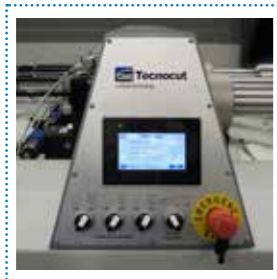
Controllo elettronico della pressione di taglio

Software-based electronic control of cutting pressure