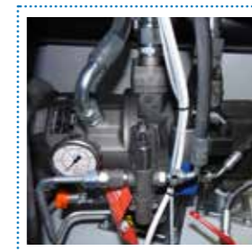
Centralina idraulica Hydraulic unit