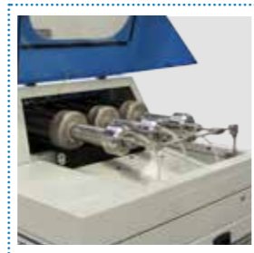
Moltiplicatori di pressione Pressure multipliers

Software-based electronic control of cutting pressure