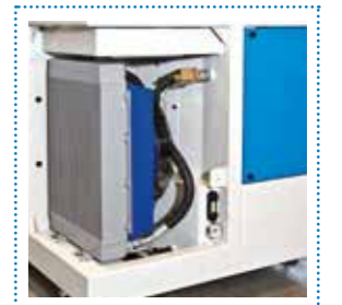
Scambiatore di calore aria/olio Oil/air heat exchanger